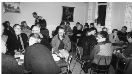
Åbenthus den 3. februar 2000.

Der var ca. 75 – 80 mennesker mødt (det er næsten umuligt at få et nøjagtigt antal, egentlig er det jo heller ikke det det drejer sig om). Jeg vil hermed på klubbens vegne sige alle tak for fremmødet og tak for alle hilsner og gaver. Tak alle sammen.